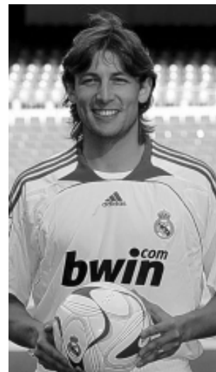
Хайнсе голи зебо зад