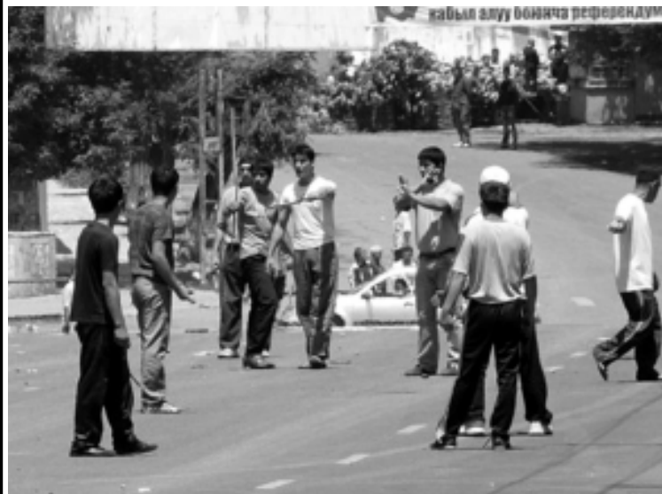
Садҳо нафар ҷавонон бо аслиҳа дар хиёбонҳо бар зидди яқдигар ҷангиданд