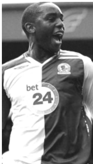
Тшабалала голи аввалинро зад