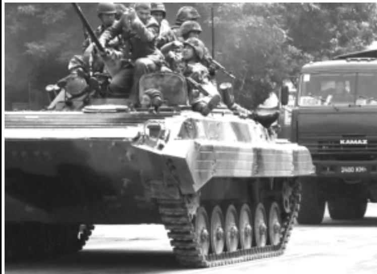
Техникаи зиреҳдори нисомӣ барои таъмини амнияти оромӣ вориди шаҳр шуд

Ӯ ва наздикони дигари Қурмонбек Боқиев ҳамчунин дар таҳрики бенизомиҳо дар ҷануби Қирғизистон низ муттаҳам мешаванд.